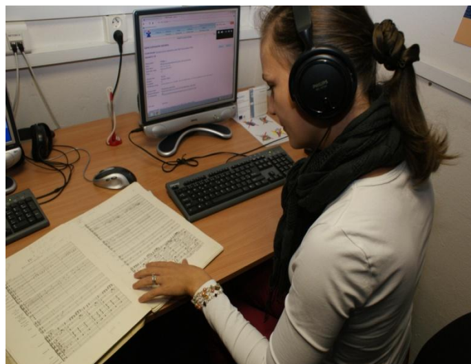
DHD poskytuje štúdium so sledovaním diela v partitúre: Cikker: Slovenská suita

Multimediálna a databázová študovňa... „, slúži na vypracovávanie rešerší z domácich i svetových databáz a zároveň je vybavená multimediálnymi počítačmi, na ktorých je možný prístup k Digitálnej hudobnej databáze (DHD). Vyhľadávať v záznamoch DHD sa dá z ktoréhokoľvek počítača pripojeného do siete internet, počúvať nahrávky je však možné len